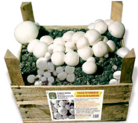
- Button mushroom - Wiesenchampignon - Seta de campo