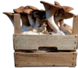
- King mushroom - Kräuterseitling - Orellana eryngii