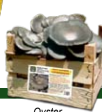
- Oyster - Austernseitling - Orellana