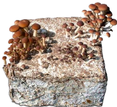
- Poplar mushroom - Südlicher Schüppling - Seta de chopo