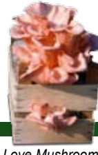
- Love Mushroom - Liebespilz - Seta del amor