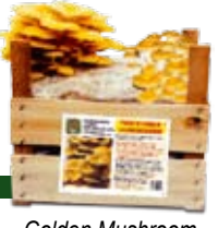
- Golden Mushroom - Goldpilz - Seta de oro